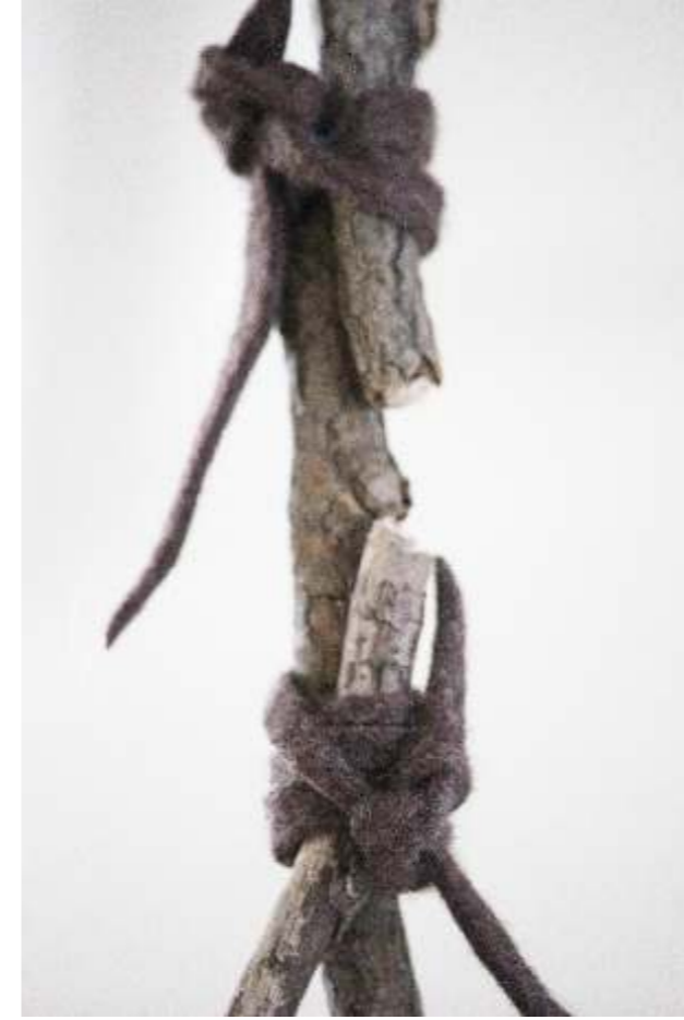
gąłazki + filc