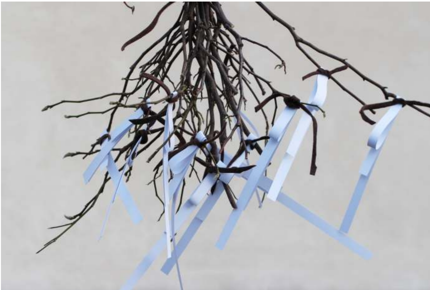
gąłazki + papier + filc